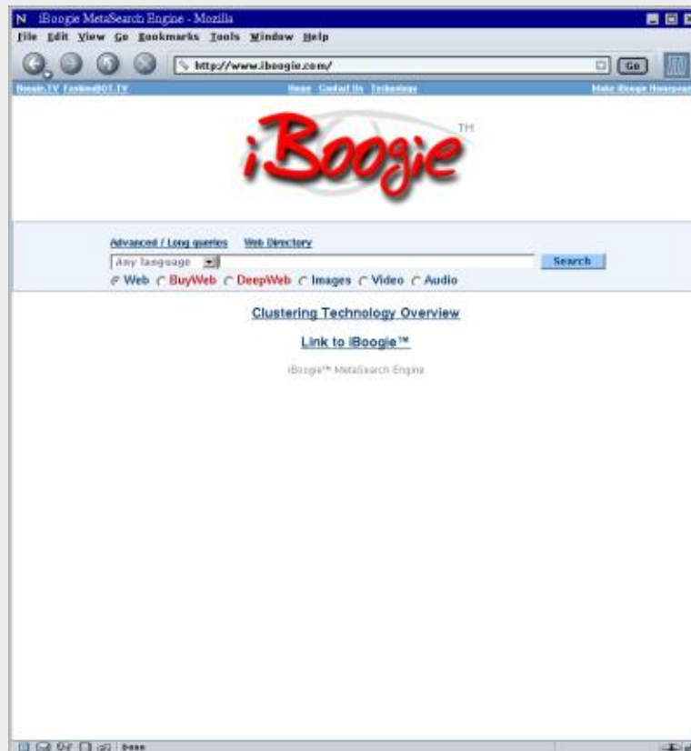
Copie écran de la page de garde du métamoteur iBoogie

La première chose que l'on remarque quand on arrive sur cet outil est l'interface simple et dépouillée. Le design Google fait décidemment bien des émules. On ne trouve d'ailleurs aucune bannière publicitaire sur le site, certains devraient peut-être s'en inspirer.