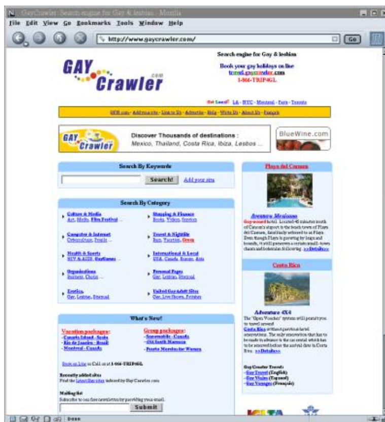
Copie écran de la page de garde du site GayCrawler

Enfin, il faut considérer Internet comme un très jeune média, et dans ce cas, si on le compare aux autres médias comme la télévision ou la presse écrite, le résultat nous montre que ces deux derniers sont déjà segmentés par thèmes, par leur pays d'origine et/ou par leurs langues. En revanche, il est très difficile de rentabiliser un outil de recherche trop ciblé sur un sujet ou une communauté de personnes, c'est très limité.