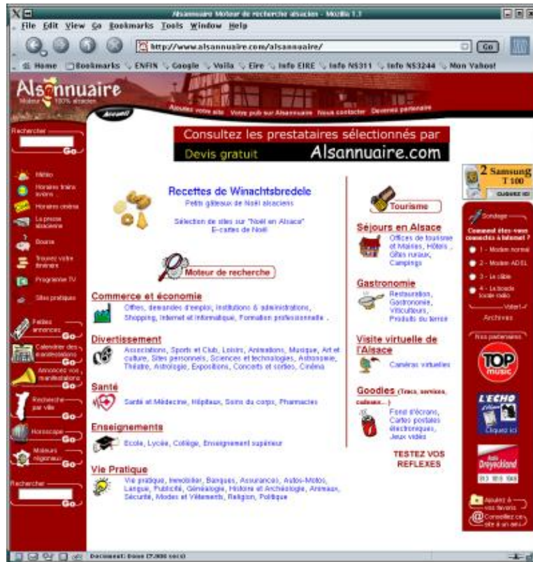
Copie écran de la page de garde du site Alsannuaire

« Moteurzine ». — Quel est le processus à suivre pour s'inscrire sur votre annuaire ?