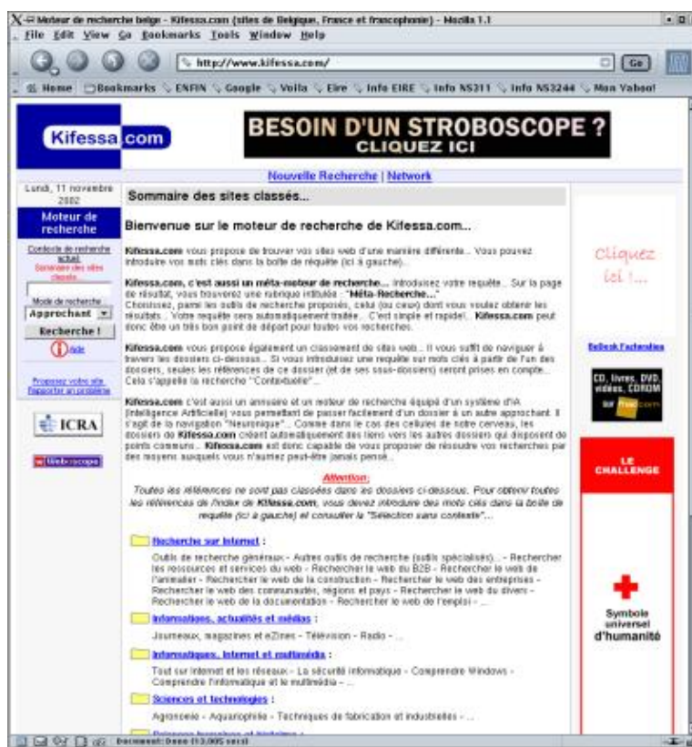
Copie écran de la page de garde du site Kifessa

Pour les autres, ils peuvent encore compter sur qui ?? Sur Enfin.com... Cette situation entraîne, pour les petits outils généralistes, d'énormes difficultés à trouver des sponsors. C'est le cas de Kifessa... Je suis pour l'instant le seul à soutenir le projet avec mes petits sous et ce qui reste de mon temps libre... Les quelques bannières du site ne rapportent même pas assez d'argent pour acheter un pain.