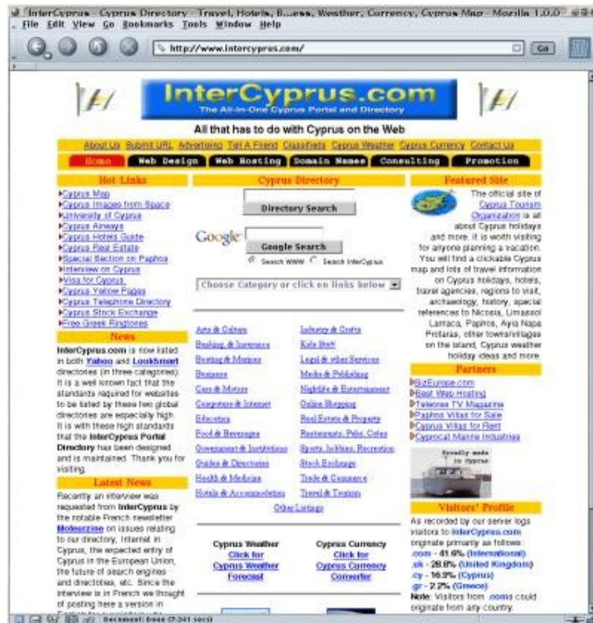
Copie écran de la page de garde du site InterCyprus

De plus, ce qui va être d'une grande aide, c'est la fin des différentes taxes et restrictions existants au niveau des importations et exportations entre l'Europe et Chypre. De même, la levée des restrictions au niveau de l'emploi, des investissements financiers, de l'immobilier, etc, va beaucoup nous aider.