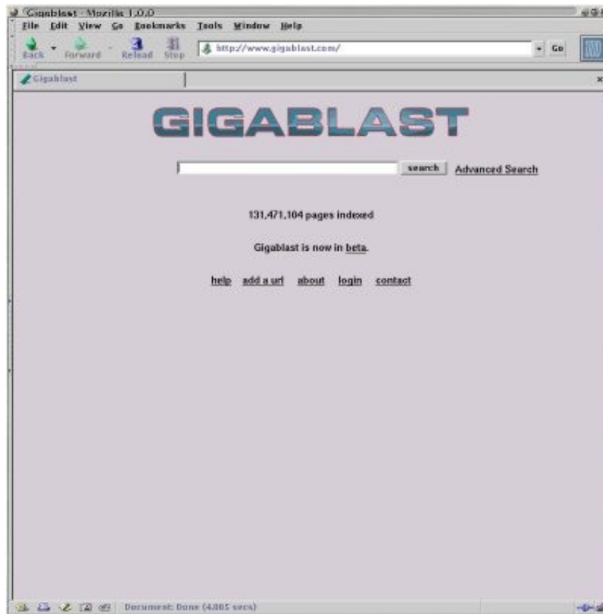
Copie écran de la page de garde du site Gigablast

« Moteurzine ». — Quelle technologie utilisez-vous pour Gigablast ?