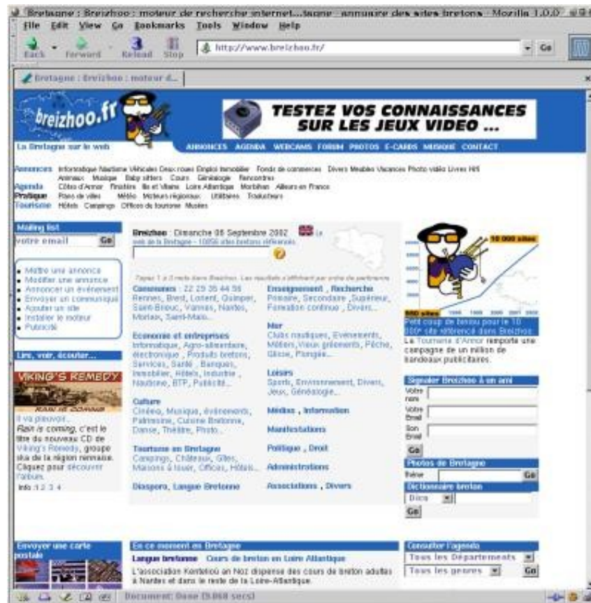
Copie écran de la page de garde du site Breizhoo

« Moteurzine ». — Quel est le processus à suivre pour s'inscrire sur votre annuaire ?