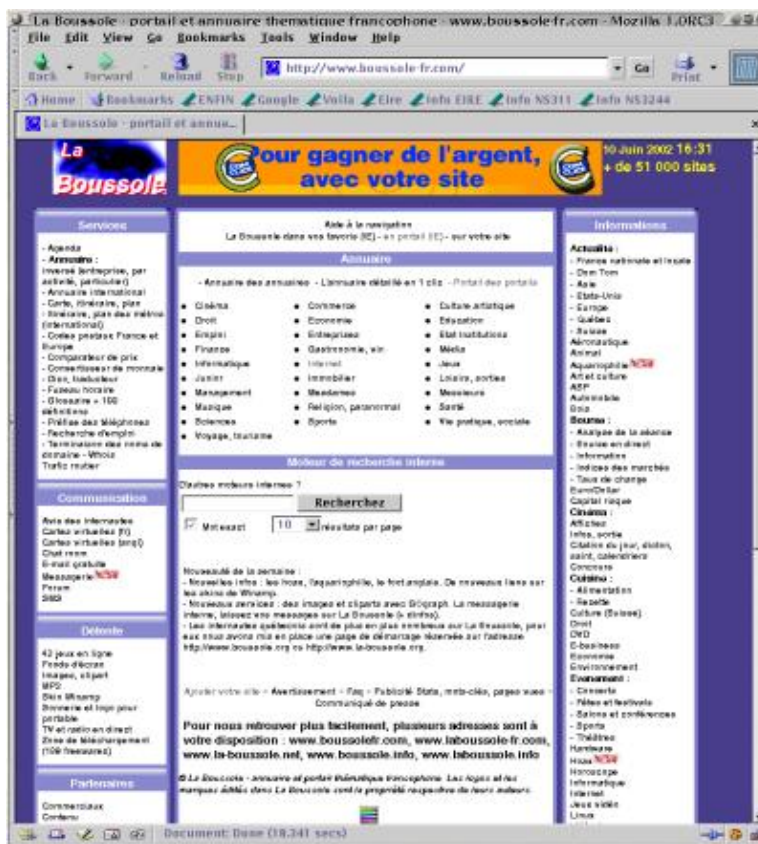
Copie écran de la page de garde du site la Boussole

« Moteurzine ». — Pensez-vous que les outils de recherche de proximité (généralistes, mais aussi et surtout régionaux et thématiques) ont vraiment leur place sur le paysage internet francophone ?