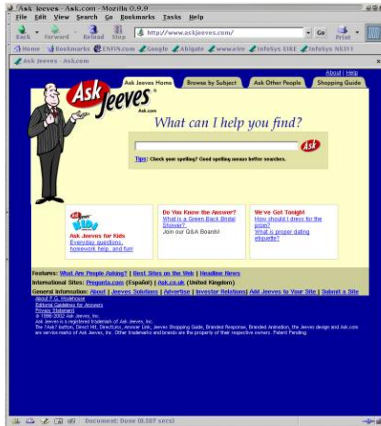
Copie écran de la page de garde du site AskJeeves

« Moteurzine ». — Avec quel moteur de recherche vous considérez-vous en compétition ?