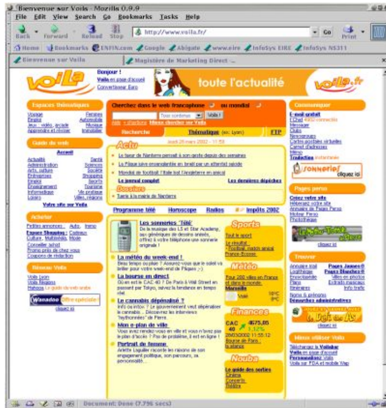
Copie écran de la page de garde du site Voila

La pression de Google est très forte. Ils ont clairement prit le segment marketing du meilleur moteur de recherche. Et donc, c'est très dur pour les autres. Altavista et Yahoo! baissent régulièrement et il ne reste que très peu d'indépendants. Ces indépendants survivent essentiellement derrière de gros portails. Néanmoins pour beaucoup de portails, la question de l'indépendance du service de recherche se pose. On ne voit pas MSN abandonner son moteur de recherche. AOL a le sien maintenant, sans doute pour les mêmes raisons. Je ne pense pas que Mirago ou Abacho vont pouvoir prendre de grosses parts de marché mais ils peuvent sans doute occuper des niches.