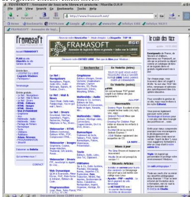
Copie écran de la page de garde du site Framasoft

«Moteurzone». — Votre annuaire référence de nombreux logiciels "libres". Mais, qu'est ce qui vous différencie par rapport à un site comme Telecharger.com ?